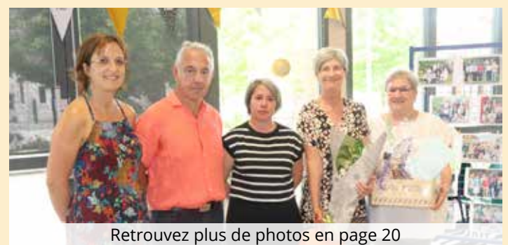
Retrouvez plus de photos en page 20

Un moment de convivialité a clôturé la réception.