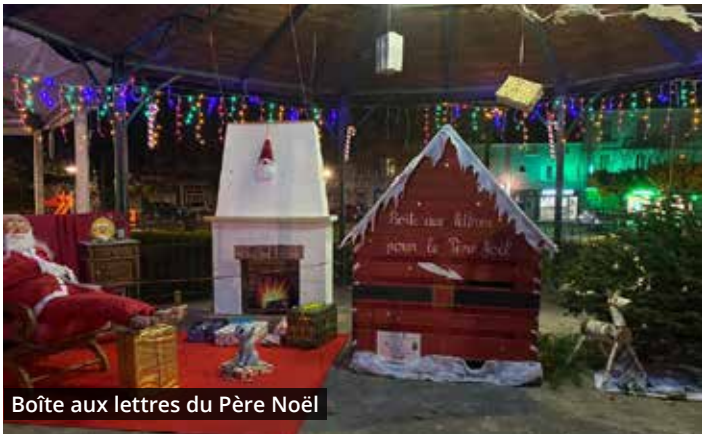
Boîte aux lettres du Père Noël