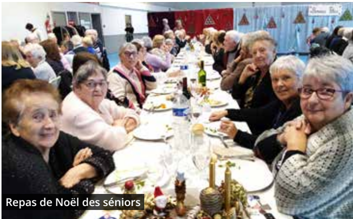
Repas de Noël des séniors