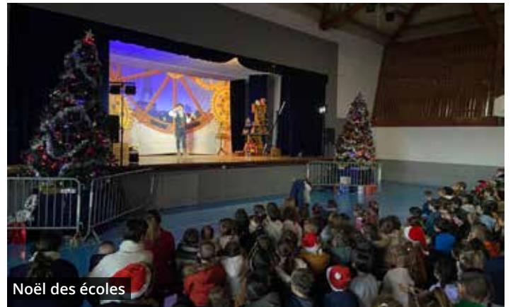
Noël des écoles