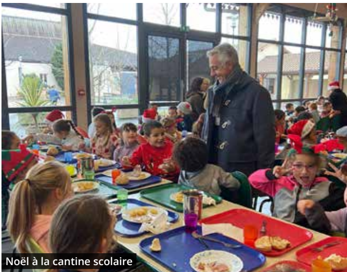
Noël à la cantine scolaire