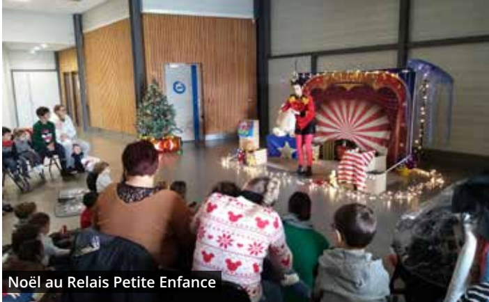
Noël au Relais Petite Enfance