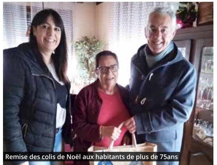
Remise des colis de Noël aux habitants de plus de 75ans