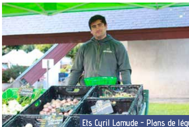
Ets Cyril Lamude - Plans de légumes