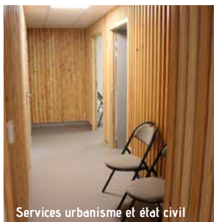
Services urbanisme et état civil