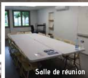
Salle de réunion