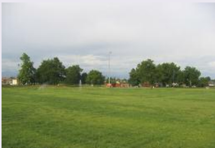
arrosage nouveau terrain de rugby

Conseil Général à son élaboration technique et financière pour l'éclairage public.