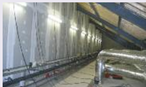
comble de l'école avec la ventilation double flux et l'alimentation électrique