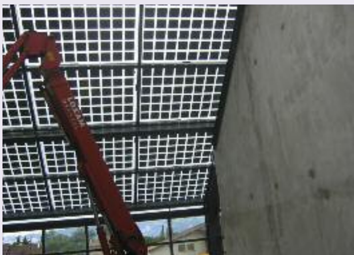
pose des panneaux photovoltaïques

Pour la nouvelle école : l'ensemble des corps de métier respecte les délais. Par contre la pose des panneaux photovoltaïques risque de retarder les peintures et la pose du sol.