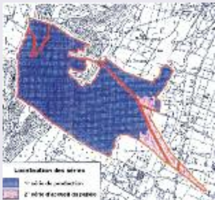
sites du bois

Le Bois du commandeur est un élément important du patrimoine privé de la commune de Bordères-sur-l'Echez.