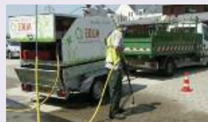
désherbeuse à eau chaude