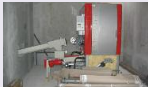
chaudière bois qui alimentera l'école, la salle polyvalente, la maternelle, et le ram.